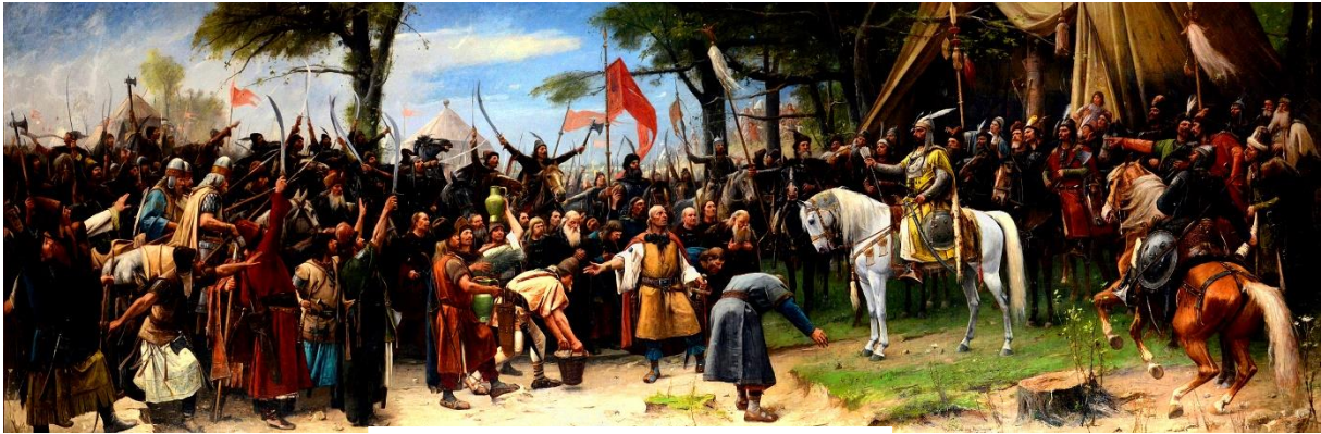
Munkácsy Mihály: Honfoglalás

körteképű kunok, laposfejű tatárok keresztbevágott szemmel, nyomott pogácsaképű besenyők, széles girbegurba fiziognómiájú, zömök termetű magyarok, apró, bent ülő szemekkel.