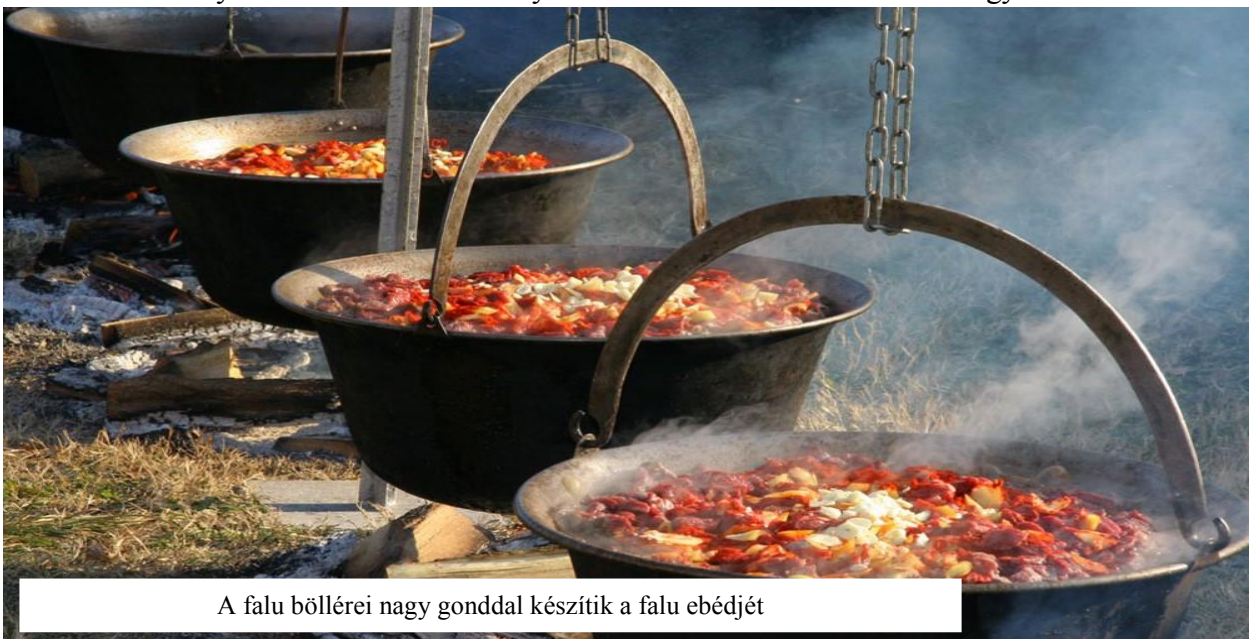
A falu böllérei nagy gonddal készítik a falu ebédjét

A hagyományosan megrendezésre kerülő Böllérfesztivál már falunk védjegye is lehetne. Egy tucat magyar mangalicát vágnak le és dolgoznak fel a falu böllérei ilyenkor. Talán ez a legnagyobb rendezvény, hisz a legfiatalabb óvodástól a legidősebb nyugdíjas bácsiig mindenki részt akar rajta venni. Természetesen ilyenkor többféle főzőversenyen vehetnek részt a böllérek és a falu egyéb lakói.