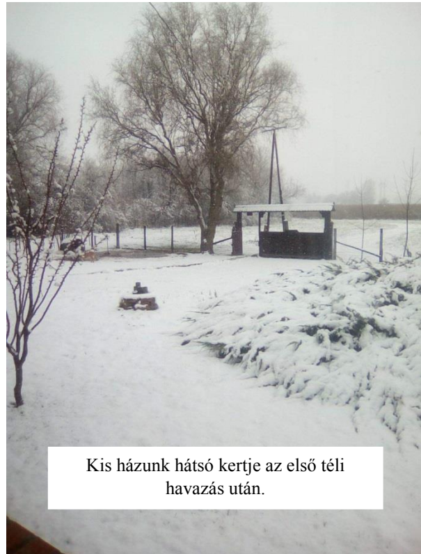
Kis házunk hátsó kertje az első téli havazás után.