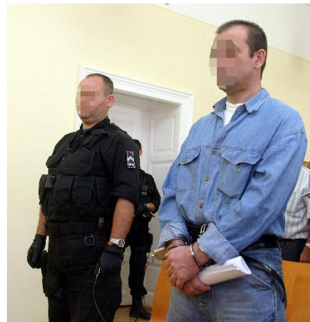
A „Rém” bilincsben