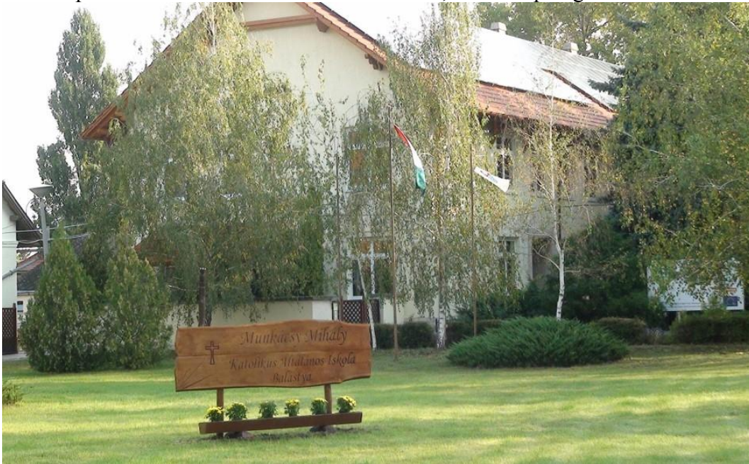
Az általános iskola fő épülete

jelölő Lenin tér- tábla őrzi a szocializmus emlékét. Maga az iskola épülete munkásszálló, az udvar közepén lévő kézműves terem köztéri mosdó, a menza pedig istálló volt.