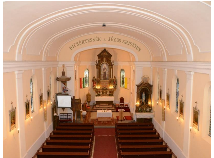
A Páduai Szent Antal templom kívül s belül

Akik a templom építésében segítettek, azoknak a nevét felírták egy papírra, és egy befőttes üvegbe tették. Ezt az üveget beleépítették a templomunkba, hogyha valaha is elbontják ezt a templomot, akkor emlékezzenek, kik építették, így nevük, ha nem is örökre, de fennmarad. 2012-ben újították fel, így aranszínű tornya büszkén magasodik a falu fölé. Belül épp olyan pompás, mint kívül, a főoltár teljes egészében fából van, egyetlen egy műanyag vagy fém része sincs. A festményen Páduai Szent Antal látható a kis Jézussal a karjában.