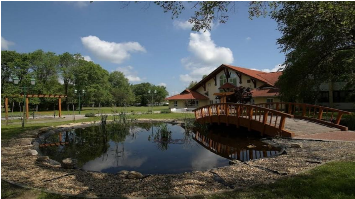
Balástya „díszparkja” az iskola mellett. Régen sokat jártam ide a barátaimmal, ma már sajnos egyre kevesebbet

A rendszerváltás után folyamatosan fejlődött a község portalanított utakkal, járdákkal, parkolókkal, gázvezeték-hálózattal, kábeltévé-rendszerrel kibővült telefonhálózattal, sportcsarnokkal, autópálya fel- és lehajtóval, csatornával. Folyamatos az épületek felújítása: iskola, óvoda, könyvtár, templom és önkormányzati épületek.