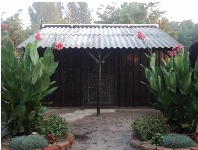
Édesapámmal közös nyári munkánk gyümölcse. Egy balástyai sose unatkozik

Haza, érdekes szó. Mindenkinek mást jelent, a többségnek Magyarországot. Nekem Balástyát. Lehet, hogy vannak szebb és jobb helyek, de nekem ez a kis falu, annyi apró csodával, annyi étellel teli emberrel, éppen megfelel.