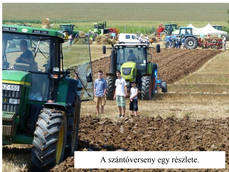
A szántóverseny egy részlete.

Az évente megrendezésre kerülő szántóverseny hatalmas izgalomban szokott eltelni. Az önkormányzat által kiadott földterületen felsorakoznak a traktorok. A traktorosok még utoljára ellenőrzik a tárcsát, ránéznek kedveseikre, gyermekeikre, egy a cél. Minél