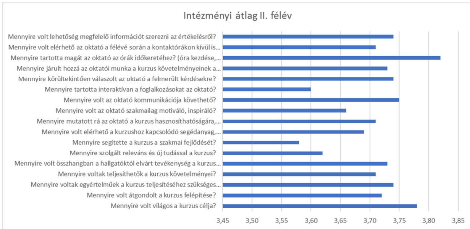
1. ábra aktuális intézményi átlagok