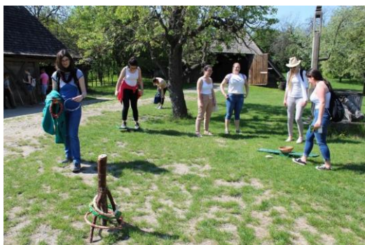
Főiskolai hallgatók hagyományos játékokat próbálnak ki

Napjainkban Magyarország települési, építkezési és gazdasági formáit 10 néprajzi tájegységben kb. 400 építmény segítségével mutatja be. A szabadtéri múzeum Magyarország jellegzetes tájainak népi építészetét, a falusi és mezővárosi társadalom különböző rétegeinek és csoportjainak lakáskultúráját, életmódját mutatja be hagyományos településtípusok keretében nagyrészt eredeti épületekkel és tárgyakkal a 18. század végétől a 20. század közepéig. A skanzen területén feltártak egy római villát, melynek konzervált falai szintén megtekinthetők.