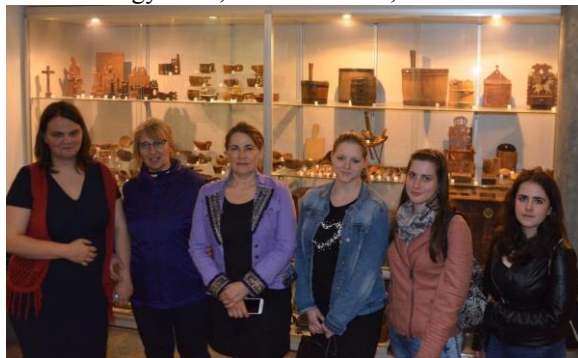
Balassagyarmat, Palóc múzeum, állandó kiállítás

Az emberi élet három nagy fordulója, a születés, házasságkötés, halál adják a kiállítás fő pilléreit, s az ezeket összekötő életszakaszok köre csoportosítják mondandójukat. A gazdag, szerteágazó téma bemutatásában fontos szerep jut a fény-képfelvételeknek, amelyek egyben segítséget nyújtanak a felsorakoztatott műtárgyak értelmezéséhez. Továbbá az élet ívét követő bemutatás során minden jelentős témaegységen belül egy-egy szokás, szokásrészlet mintegy megelevenedik, környezetet idéző tárgyegyüttesek, az alkalomhoz illő viseletbe öltöztetett bábuk segítségével. A kiállítás időben hozzávetőlegesen a 19. század utolsó harmadától az 1960-as évekig terjedő időszakot fogja át. A vidék parasztságának, életmódja, kultúrája lassabban változott, s számos régies vonást örökölt át a 20. századra. Érvényes ez a (katolikus) magyarság közé a török háborúkat követően betelepült (javarészt evangélikus) szlovákokra, s részben a (katolikus) németekre is. Bár az utóbbiaknál inkább az etnikai elszigeteltség erősítette a hagyományőrzést.