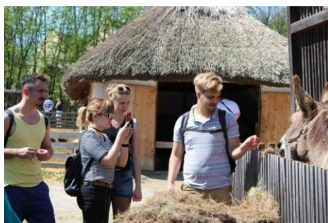
Egy alföldi tanya udvarán