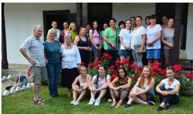
A decsi tájház előtt

A Sárköz vagy Tolna megyei Sárköz , mint néprajzi kistáj a magyar néprajztudományban többnyire Alsónyék, Decs, Őcsény és Sárpilis községek területét jelenti. A földrajzi értelemben vett Sárköz a néprajzi tájnál nagyobb területet jelöl. A Sárköz név a néprajzi szerzők többsége számára a két világháború között, a 20. században szűkült le a Tolna megyei nevezetes négy falura.