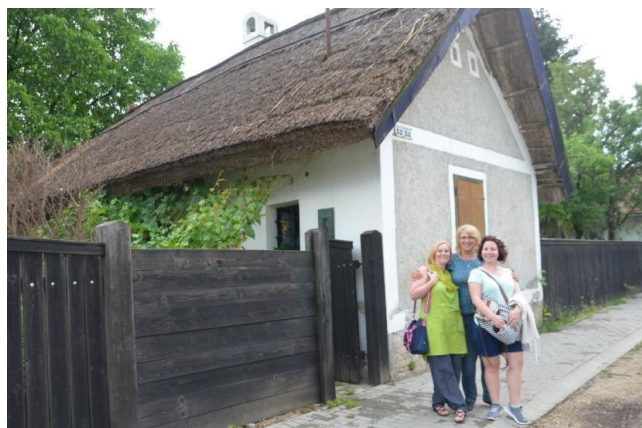
Bogár tanya: hálótanya, a szőlőörzés helyszíne

A jeles névünnepek alkalmával a névnapi köszöntést, az aprószenteki suprikálást, az újév-köszöntést. Megtartották a farsangot, elterjedt volt a nagypénteki mosakodás és féregűzés, a Szent György napi harmatszedés.