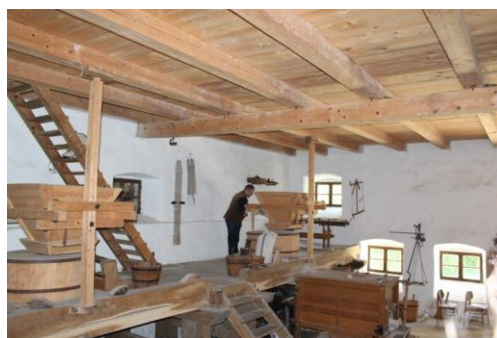
„A malomnak nincsen köve, mégis lisztet jár...” A nyirádi vízimalom működésének megfigyelése