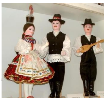
Decs - Babamúzeum

A sárközi táncdialektus a kelet-dunántúli csoporthoz tartozik, amely tovább folytatódik a Duna-Tisza közti Bácskába, Kalocsán és környékén, és általában a Duna egész mellékén. A sárközi táncok közül a nők karikázója (körtánca) tér el legjobban az országosan ismert típusoktól, ez a legjellemzőbb és talán a legszebb táncuk.